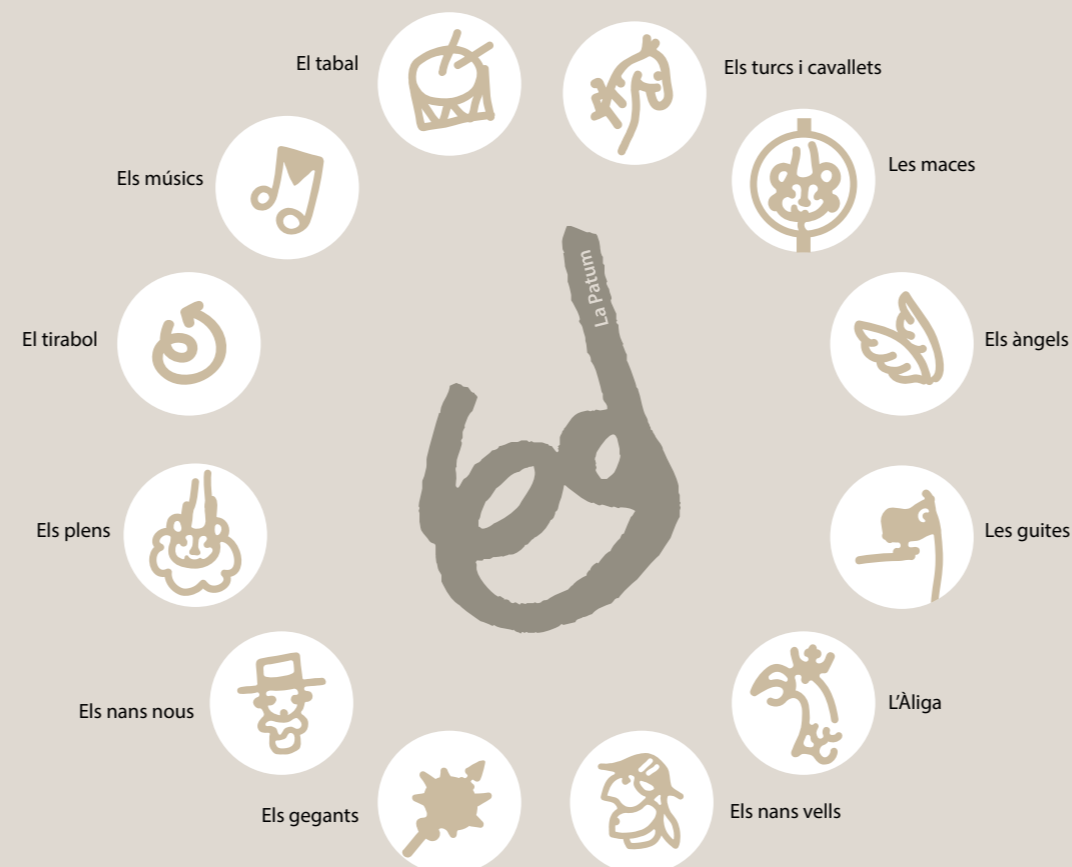
Relleu de les comparses de La Patum a la Pl. de St. Pere

La ruta Un paseo por Berga, a través de un recorrido circular básicamente por el casco antiguo de la ciudad, pretende que los visitantes puedan conocer esta parte de Berga y se formen una idea de su historia y de sus características urbanísticas y arquitectónicas.