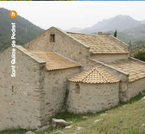
Sant Quirze de Pedret h