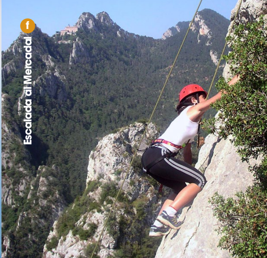
Escalada al Mercadal f