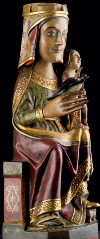
La imatge de la Mare de Déu